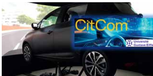
ImPACT VR & Motion

Plus concrètement, ces moyens expérimentaux et les études menées doivent permettre de sécuriser l'usage de l'IA et de proposer des voies d'amélioration de ses performances permettant de garantir sa fiabilité.